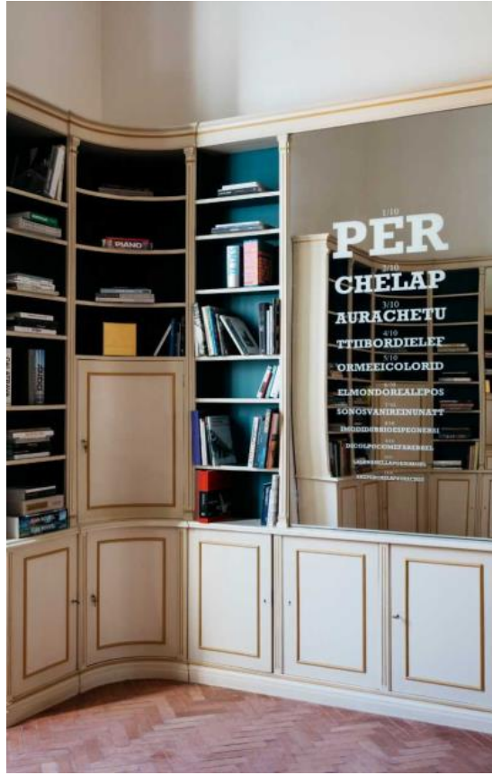
# 秘密图书馆 塞克利 Luigi de Secly