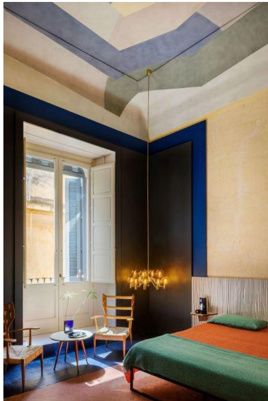
墙壁上的手绘条纹织物、墙壁和地板上的色块以及金色装饰营造出充满活力的氛围，1960年代的枝形吊灯增添复古魅力。