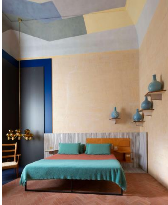
MARIA D'ENGHIEN 套房由朱利亚诺·德尔乌瓦设计，位于主楼层和大楼最古老的部分。这里是莱切伯爵夫人和那不勒斯王后曾经住过的房间。