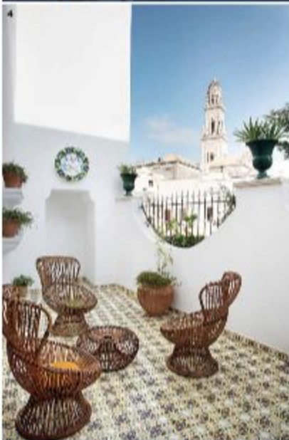
1. Лекс Maria d'Enghien, оформленный Джузеппе Дель'Ука. 2. Центр отеля – гостиная, решенная в голубых тонах, где разместились некоторые работы Альфредо Джарра, массивная люстра Константина Греча, редкое зеркало Этторе Соттсаса и письменный стол, созданный Диего Понти для его дочери Лизы. 3. Контраст белого и глубокого тона морской волны был характерен для Диего Понти. 4. Терраса с видом на исторический центр города. 1. Licia Maria d'Enghien, designed by Giuliano De'Uva. 2. The center of the hotel is the living room, designed in blue tones, where neon works by Alfredo Jaar, a massive chandelier by Konstantin Grcic, a rare mirror by Ettore Sottsass and a desk created by Gio Ponti for his daughter Lisa are located. 3. The contrast of white and deep sea waves was characteristic of Diego Ponti. 4. Terrace overlooking the historic city center.