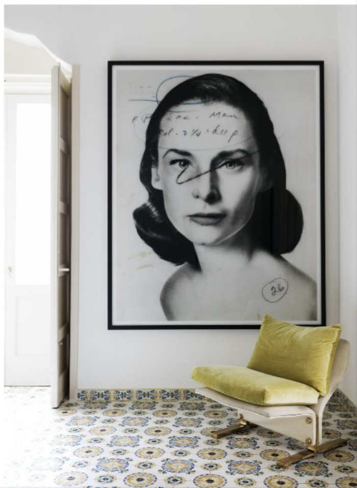
SOPRA Breakfast Room. A SINISTRA Blue Ponti Room. A DESTRA Fanciullino Room.